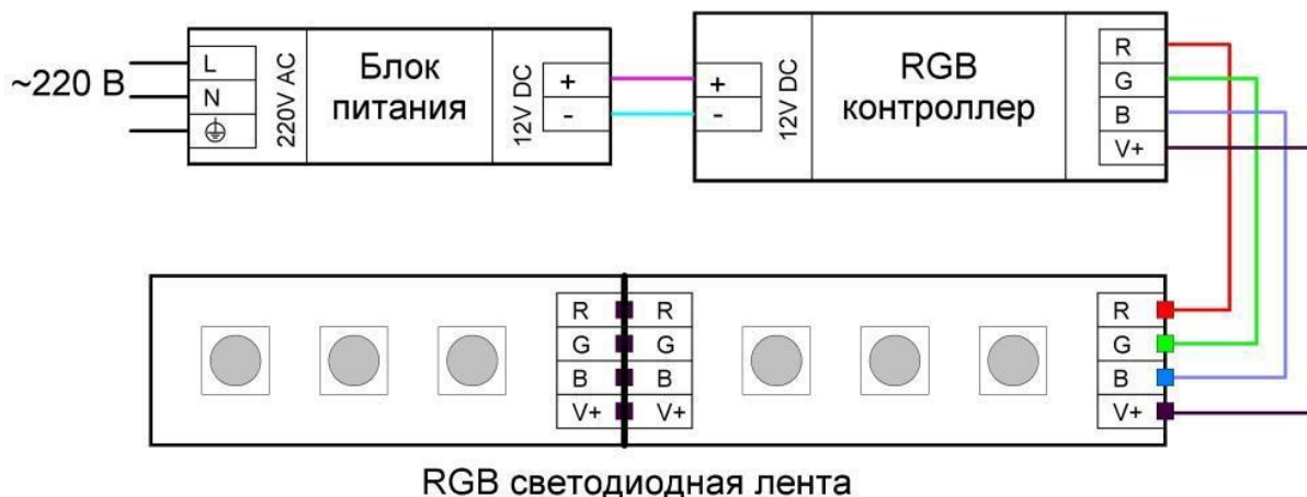
Подключение RGB светодиодной ленты

Контроллеры бывают разные по внешнему виду, мощности, программам управления цветом и пультам дистанционного управления. Но принцип везде один. На контроллер приходит 2 провода от блока питания, а уже от контроллера уходит четыре провода на RGB-ленту. Которые правильно подключаем согласно маркировке на концах провода и ленты соответственно: