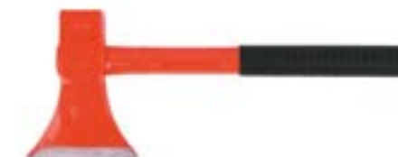
Топор кованый LOM