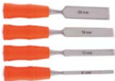
Набор стамесок-долот LOM