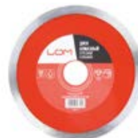
Диск алмазный отрезной LOM (мокрый рез)