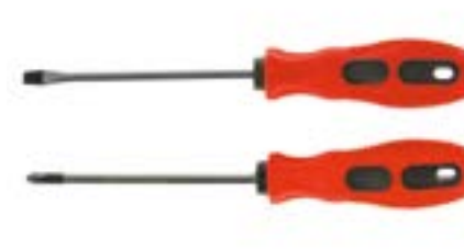
Набор отверток LOM (2 предмета, двухкомпонентная рукоятка)