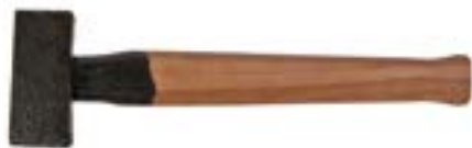
Кувалда литая LOM (деревянная рукоятка)