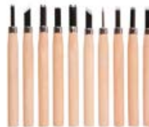
Набор резцов по дереву LOM (деревянная рукоятка)