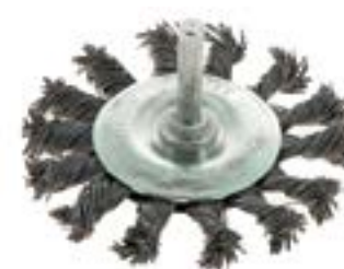
Щетка металлическая LOM для дрели (со шпилькой)