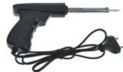
Паяльник-пистолет LOM 220 В