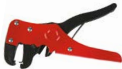
Клеши для снятия изоляции LOM