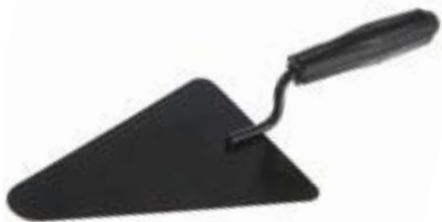
Кельма бетонщика LOM