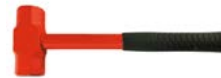
Кувалда кованая LOM (металлическая обрезиненная рукоятка)