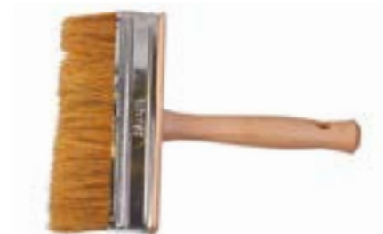
Кисть-макловица LOM (деревянная рукоятка)