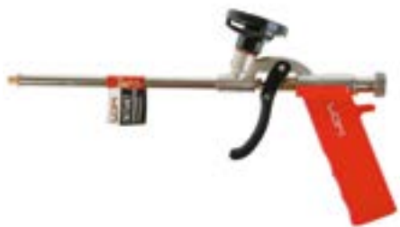
Пистолет для монтажной пены LOM