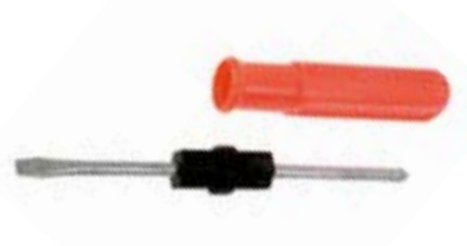
Отвертка 2 в 1 LOM (пластиковая рукоятка)