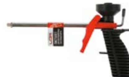
Пистолет для монтажной пены LOM