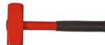
Кувалда кованая LOM (металлическая обрезиненная рукоятка)