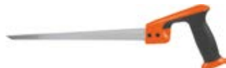
Ножовка для гипсокартона LOM