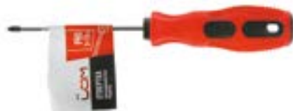
Отвертка крестовая LOM (двухкомпонентная рукоятка)