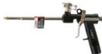
Пистолет для монтажной пены LOM