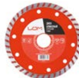
Диск алмазный отрезной LOM (сухой рез)