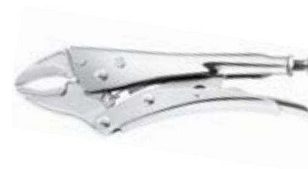
Клещи зажимные LOM