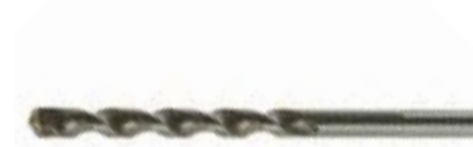
Сверло по бетону LOM