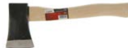
Топор LOM (с клином)