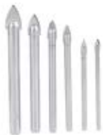
Набор сверл по керамической плитке LOM