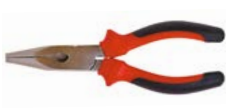
Длинногубцы LOM (никелированные)