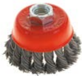
Щетка металлическая LOM для УШМ