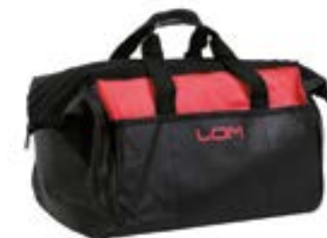
Сумка для инструментов LOM