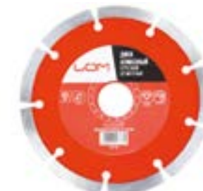
Диск алмазный отрезной LOM (сухой рез)