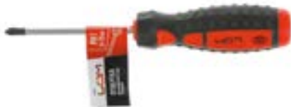
Отвертка крестовая LOM (двухкомпонентная рукоятка)