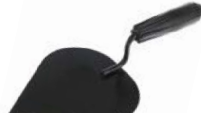
Кельма штукатур LOM