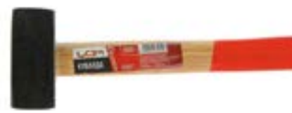
Кувалда LOM (деревянная рукоятка)