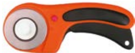
Нож с круглым лезвием LOM