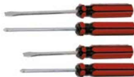
Набор отверток LOM (4 предмета, пластиковая рукоятка)