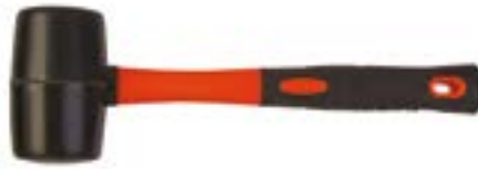
Киянка LOM (черная резина)