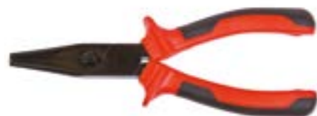
Тонкогубцы LOM (черные)