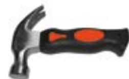
Молоток-гвоздодер МИНИ LOM (двухкомпонентная рукоятка)