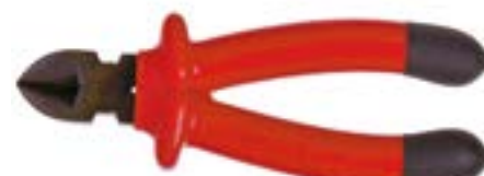
Бокорезы LOM (диэлектрические)