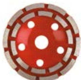
Чашка алмазная зачистная LOM