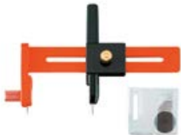
Нож циркульный LOM