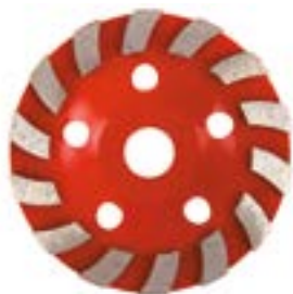
Чашка алмазная зачистная LOM