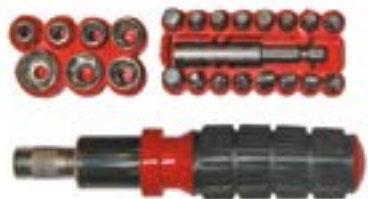
Отвертка и набор бит LOM