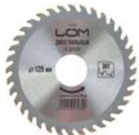
Диск пильный по дереву