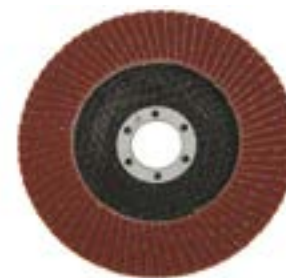
Круг лепестковый торцевой LOM