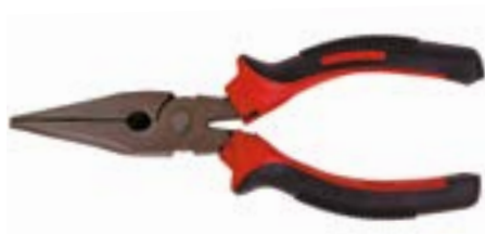
Тонкогубцы LOM (шлифованные)