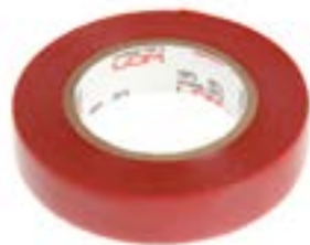
Изолянта LOM ПВХ