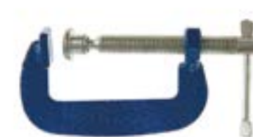
Струбцина LOM G-образная