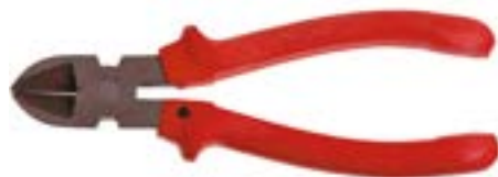
Бокорезы LOM (шлифованные)