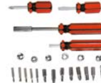
Набор отверток и бит LOM