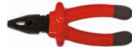
Плоскогубцы LOM (диэлектрические)