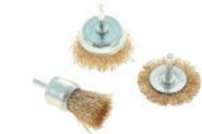
Набор щеток металлических LOM (для дрели)