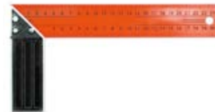
Угольник металлический LOM