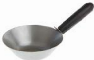
Ковш штукатурный LOM (с площадкой)