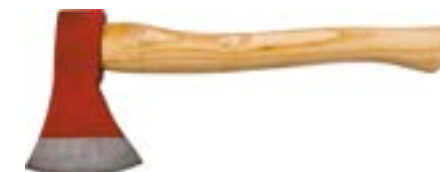
Топор столярный LOM