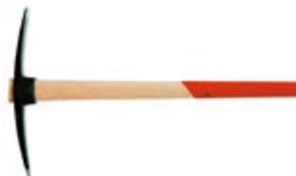
Кирка LOM кованая (деревянная рукоятка)