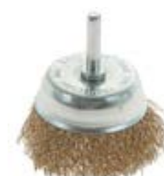
Щетка металлическая LOM для дрели (со шпилькой)