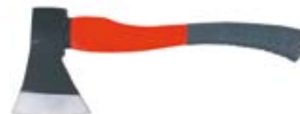
Топор столярный LOM