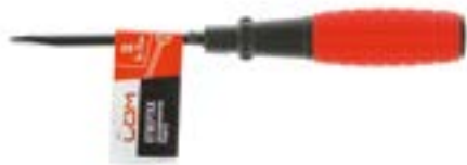
Отвертка шлицевая LOM (двухкомпонентная рукоятка)