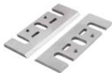
Ножи для электрорубанка LOM (HCS)