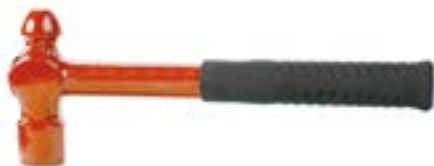
Молоток слесарный LOM кованый (цельнометаллический)