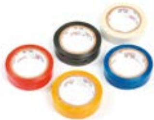
Изолянта LOM ПВХ (набор 5 шт.)