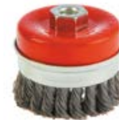
Щетка металлическая LOM для УШМ (Heavy Duty)