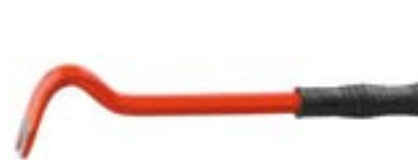
Гвоздодер LOM (шестигранный)