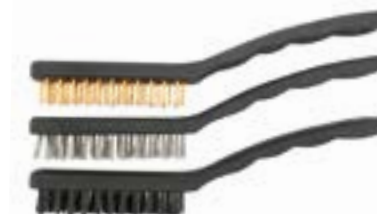
Набор щеток металлических LOM (ручные с пластиковой рукояткой)