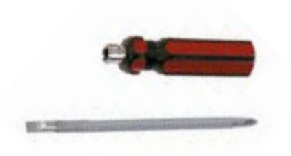
Отвертка 2 в 1 LOM (пластиковая рукоятка)