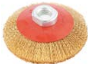
Щетка металлическая LOM для УШМ