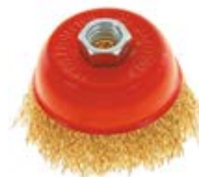
Щетка металлическая LOM для УШМ