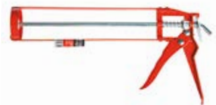
Пистолет для герметика LOM