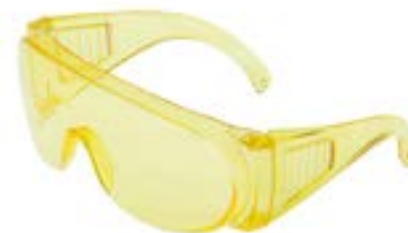
Очки защитные LOM