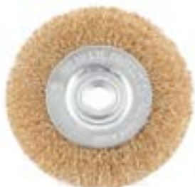
Щетка металлическая LOM для УШМ