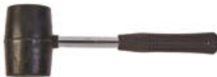
Киянка LOM (черная резина)