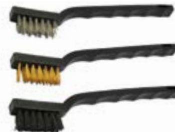
Набор щеток металлических LOM (ручные с пластиковой рукояткой)