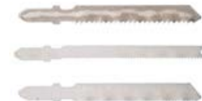
Полотна для электролобзика LOM по металлу (HSS)