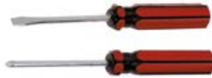
Набор отверток LOM (2 предмета, пластиковая рукоятка)