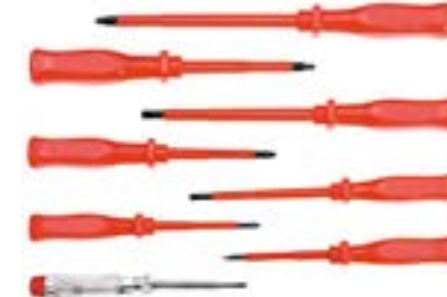
Набор отверток диэлектрических LOM