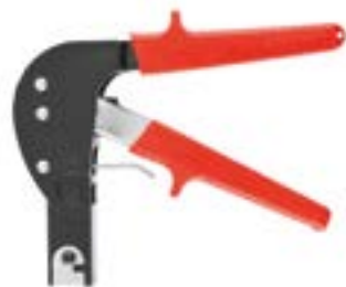
Заклепочник LOM типа «Молли»