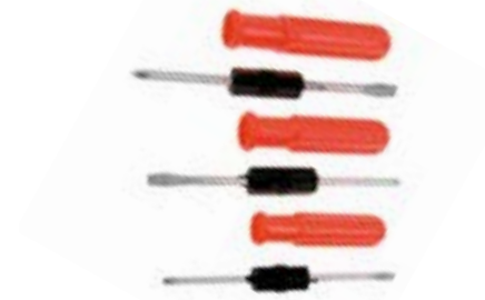
Набор отверток LOM (3 предмета)