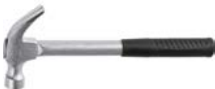
Молоток-гвоздодер LOM кованый (цельнометаллический)