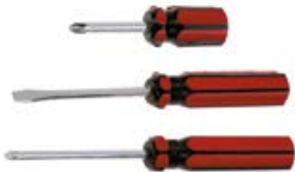
Набор отверток LOM (3 предмета, пластиковая рукоятка)