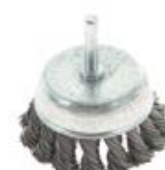
Щетка металлическая LOM для дрели (со шпилькой)