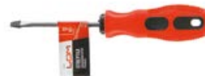
Отвертка шлицевая LOM (двухкомпонентная рукоятка)