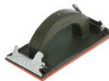
Брусок для шлифования LOM (с зажимами)