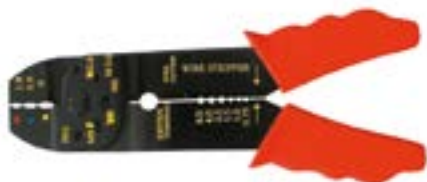
Клеши для снятия изоляции LOM