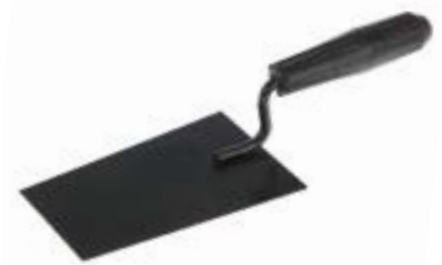
Кельма отделочника LOM