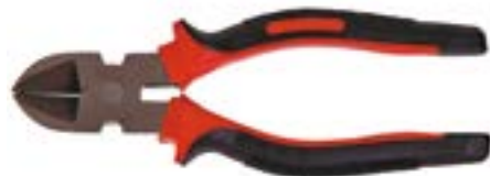
Бокорезы LOM (шлифованные)