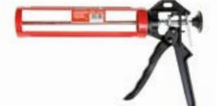
Пистолет для герметика LOM