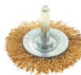
Щетка металлическая LOM для дрели (со шпилькой)