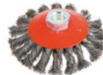
Щетка металлическая LOM для УШМ