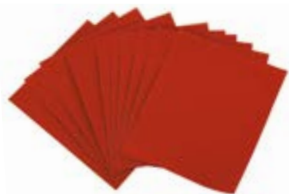
Шкурка шлифовальная в листах LOM (на бумажной основе, водостойкая)