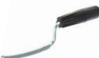
Расшивка LOM (пластиковая рукоятка)