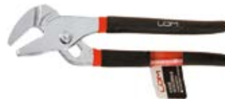
Клещи переставные LOM хромированные (обрезиненные рукоятки)