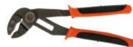
Клещи переставные LOM (двухкомпонентные рукоятки)