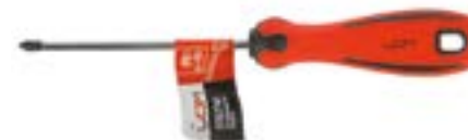
Отвертка крестовая LOM (двухкомпонентная рукоятка)