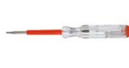
Отвертка индикаторная LOM (пластиковая рукоятка)