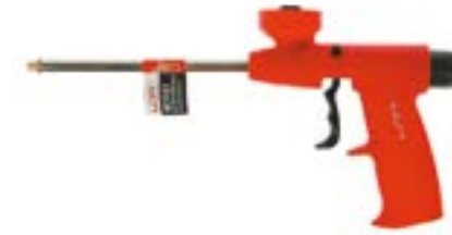
Пистолет для монтажной пены LOM