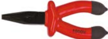
Длинногубцы LOM (диэлектрические)