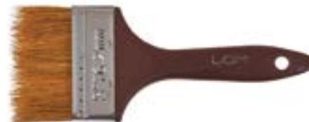
Кисть плоская LOM (пластиковая рукоятка)