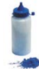
Порошок красящий для малярных шнуров LOM