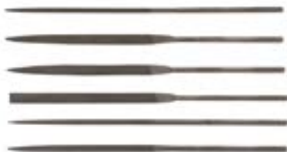
Набор надфилей LOM