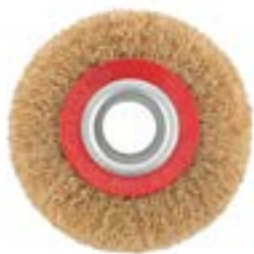
Щетка металлическая LOM для точила