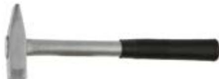
Молоток слесарный LOM кованый (цельнометаллический)