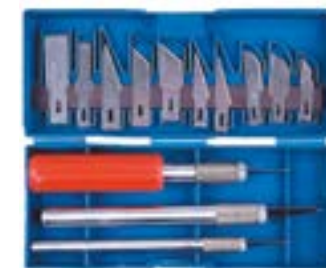
Набор резцов по дереву LOM (пластиковая рукоятка)