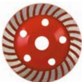
Чашка алмазная зачистная LOM