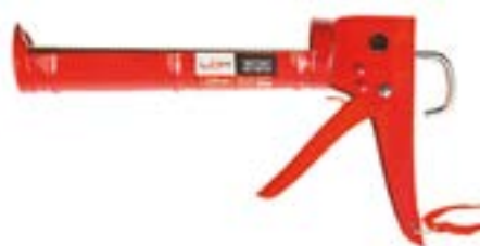
Пистолет для герметика LOM