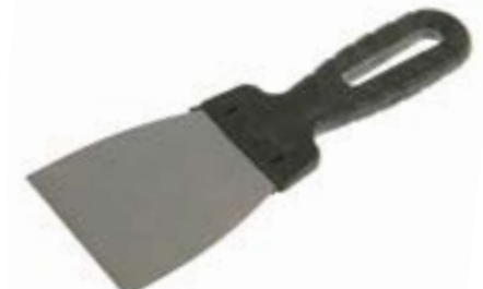
Шпатель металлический LOM