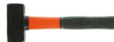
Кувалда LOM (фибергласовая рукоятка)