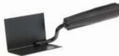
Кельма угловая LOM (внутренняя)