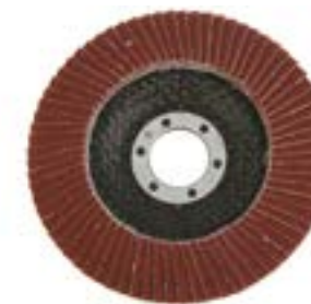
Круг лепестковый конический LOM