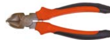
Бокорезы LOM (никелированные)