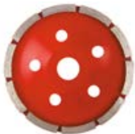
Чашка алмазная зачистная LOM