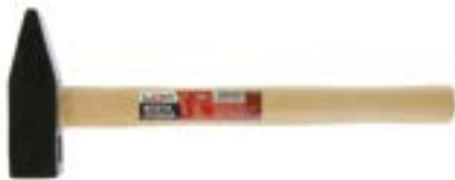
Молоток слесарный LOM (деревянная рукоятка)