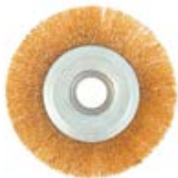
Щетка металлическая LOM для УШМ