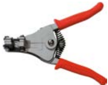
Клеши для снятия изоляции LOM (пластиковые рукоятки)