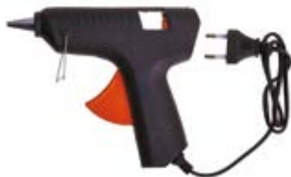
Клеевой пистолет LOM