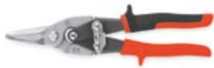
Ножницы по металлу LOM