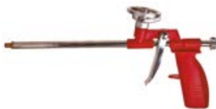
Пистолет для монтажной пены LOM