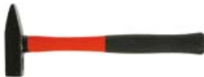
Молоток слесарный LOM (фибергласовая обрешиненная рукоятка)