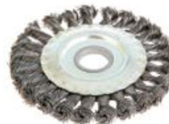
Щетка металлическая LOM для УШМ