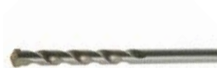
Сверло по бетону LOM