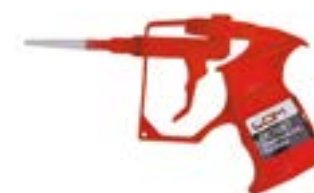
Пистолет для монтажной пены LOM