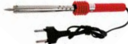
Паяльник LOM 220 В