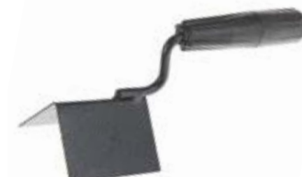
Кельма угловая LOM (внешняя)