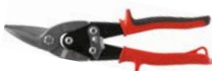
Ножницы по металлу LOM