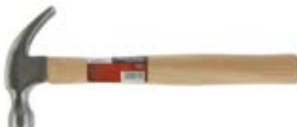
Молоток-гвоздодер LOM (деревянная рукоятка)