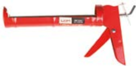
Пистолет для герметика LOM