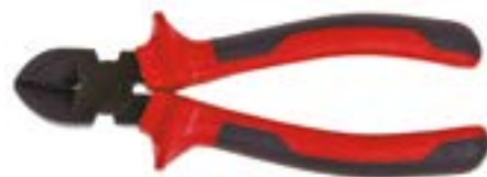
Бокорезы LOM (черные)