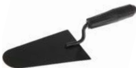
Кельма каменщика LOM