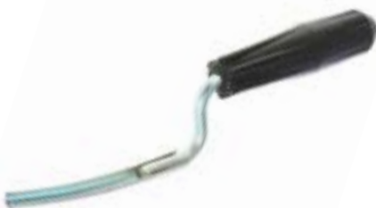
Расшивка LOM (пластиковая рукоятка)