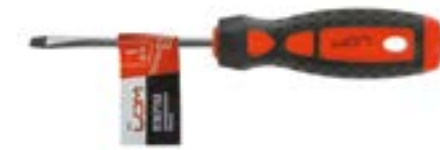
Отвертка шлицевая LOM (двухкомпонентная рукоятка)