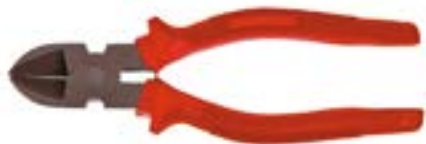
Бокорезы LOM (шлифованные)