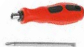
Отвертка 2 в 1 LOM (двухкомпонентная рукоятка)