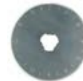
Набор сменных лезвий круглых LOM