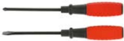
Набор отверток LOM (2 предмета, двухкомпонентная рукоятка)