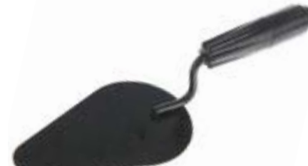
Кельма печника LOM