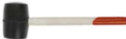
Киянка LOM (черная резина)