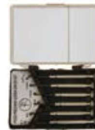
Набор отверток для точных работ LOM