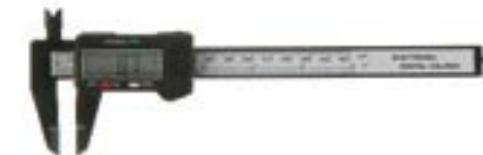
Штангенциркуль электронный LOM