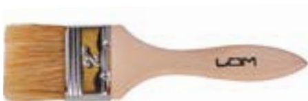
Кисть плоская LOM (деревянная рукоятка)