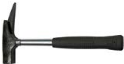
Молоток кровельщика LOM (металлическая обрезиненная рукоятка)