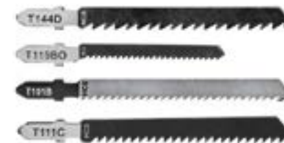
Полотна для электролобзика LOM по дереву (HCS)