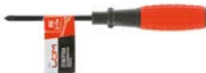
Отвертка крестовая LOM (двухкомпонентная рукоятка)