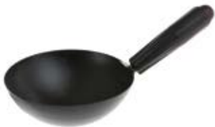
Ковш штукатурный LOM