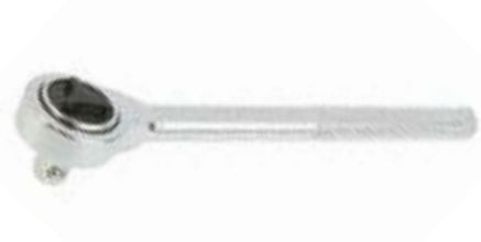
Вороток с трещоткой LOM