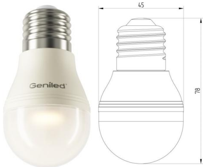
Рисунок 1 – Внешний вид.

Светодиодная лампа Geniled E27 G45 5W - со светодиодами повышенной яркости NationStar SMD3528. Эффективный теплоотвод достигается за счет плотного соединения светодиодной платы с алюминиевым радиатором, который покрыт термопроводящим пластиком. Колба лампы выполнена из ударопрочного матового поликарбоната. Лампа используется в светильниках и бра с цоколем E27 в качестве замены традиционных ламп типа «шарик».