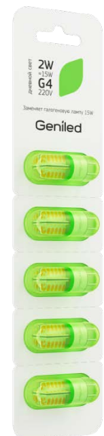
Рисунок 2 – Внешний вид упаковки.

Примечание: не пригодна для использования совместно со стандартными регуляторами уровня яркости.